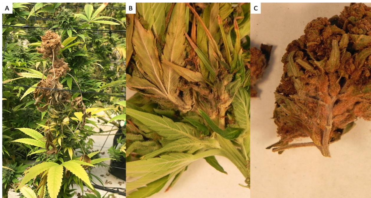
איור 3. צמחי קנביס נגועים בעובש אפור ותסמיני המחלה בשלבי גידול שונים. (A) צמח בוגר לקראת סיום שלב ההפרחה, (B) תפרחות טריות ו- (C) תפרחות לאחר גיזום עלעלים וייבוש.

עובש אפור - תוקפת תפרחות קנביס ונגרמת על ידי הפטרייה Botrytis cinerea הנפוצה ומוכרת בעולם (Punja, 2018). תסמיני המחלה דומים מאוד לכתמי חלפת, וללא בדיקה מיקרוסקופית או בידודים, קשה מאוד להבדיל ביניהן (איור 3, B4). בשונה מ A. alternata הטמפרטורה האופטימלית להדבקה ונביטת נבגים היא 20 מ"צ, וטמפי הגדילה האופטימלית היא 24 מ"צ. B. cinerea משגשגת באקלים קריר ולח (McPartland et al., 2017). תסמיני המחלה הראשונים מתפתחים בחלקים הפנימיים של התפרחות ולכן קשה להבחין בהם בתחילה, בהמשך עלי המניפה (העלים הצמודים לתפרחת עצמה) מצהיבים ונובלים, הפטרייה ממשיכה להתפשט ומתחילה לייצר קורים אפורים העוטפים את כל התפרחת (McPartland et al., 2017; Jerushalmi et al., 2020).